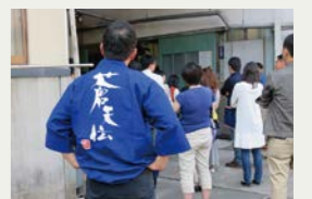
気仙沼 男山酒造さん見学の様子