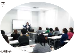
これまでの講座の様子