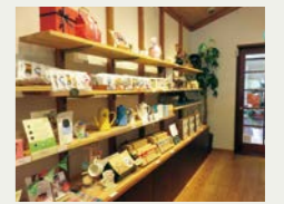
アンカーコーヒーさんの店内