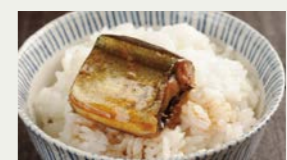
齊吉商店看板商品「金のさんま」