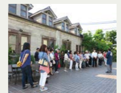
世嬢の一酒造さん見学の様子