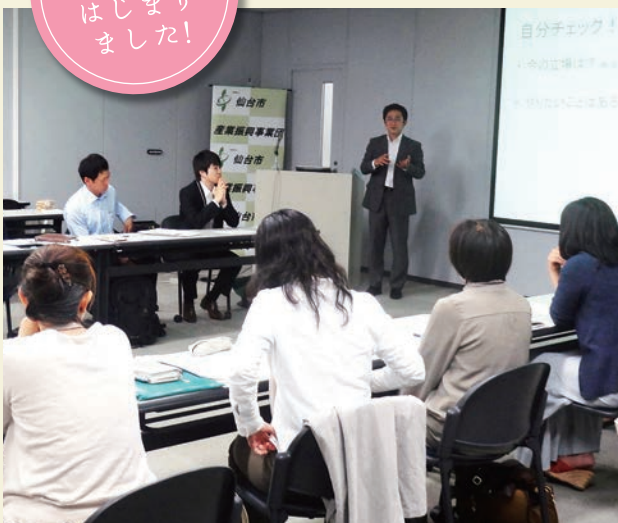
▲「めざせ! ちっちゃなカフェ・飲食店コース」初回の様子