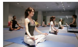
「この夏こそ簡単ボディメイク」