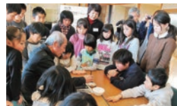
「雄勝石に絵を描こう」