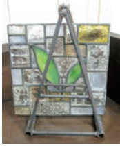
震災を忘れない…、泥がついたまま飾ってあるステンドグラス