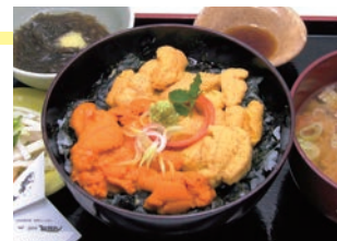
8月いっぱい期間限定メニュー「紅白うに合戦」

◎アクセス JR石巻駅から徒歩約15分 住所/石巻市南中里3-15-28 TEL.0225-22-2851 営業時間/11:30-14:00、17:00-21:00(L020:30) 定休日/月曜日(祝日の場合は火曜日) http://tomofuku.wordpress.com/