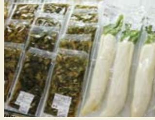
▲さゆりたりまり漬け 220円