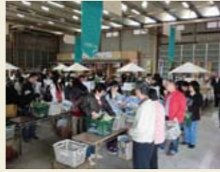
▲NPO法人小十郎まちづくりネットワークが運営

〒989-0232 白石市福岡長袋字八斗1 0224-22-0881 9:00~19:00 無し(年末年始5日間のみ)