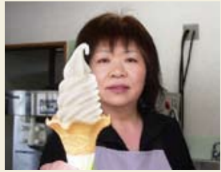
▲りんごソフト(250円)はテイクアウトコーナー「森のほたる」で

〒987-0901 登米市東和町米川字六反33-1 0220-45-1218 無し 立食いコーナー 8:30~16:30、テイクアウト(森のほたる) 9:00~18:00、レストラン 9:30~18:00(L.O.)、売店 9:30~18:30