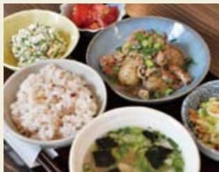
▲小鉢セット 昼750円 夜850円