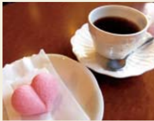
▲コーヒー 300円 木いちこのマカロン 180円