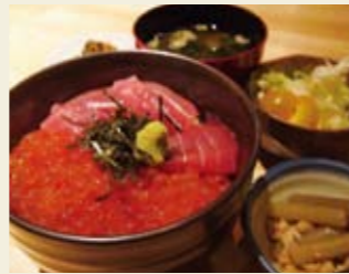
▲ランチメニュー まぐる&いくら丼 980円