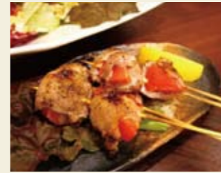
▲トマト巻 1本 240円

〒980-0811 仙台市青葉区国分町2-5-15 東ビルB1F 022-398-3821 17:00~27:00(日曜・祝は~24:00) なし