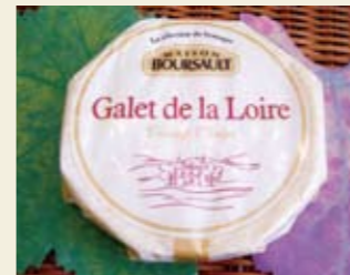
▲ガレット・ラロワール 1個 1,292円