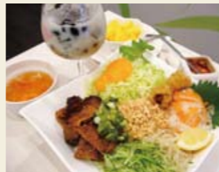
▲ベトナム冷麺(デザート付き) 1,250円