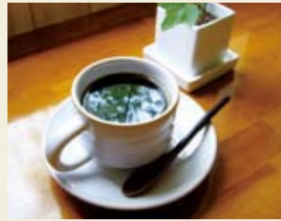
▲ブレンド「まめ坊」 600円