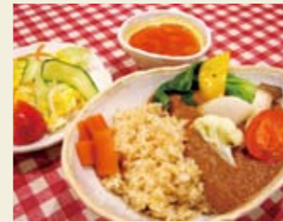
▲サラダバーランチ 980円