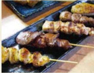
▲おすすめ5本串焼き 700円