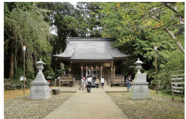
陸奥総社宮はパワースポットなのだそうです