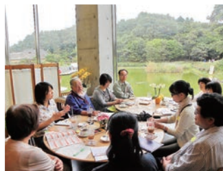
わいわいと楽しく意見交換、アイデアワーク&交流会