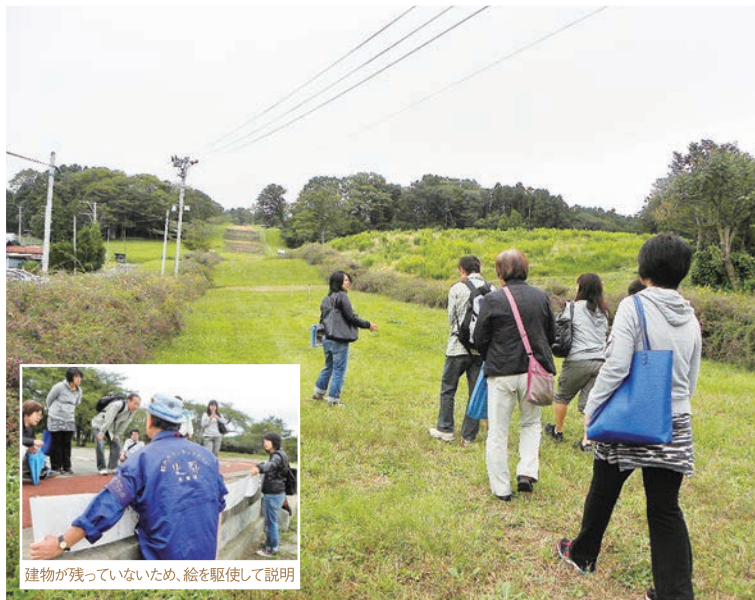
建物が残っていないため、絵を駆使して説明