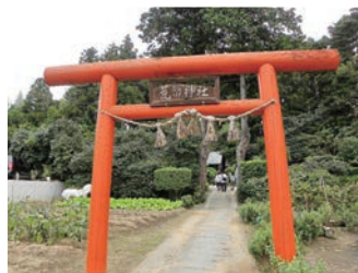
青森の方が好きだというアラハハキ神社にも立ち寄り