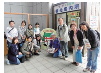
多賀城のキャラクターたがもんと一緒にパチリ