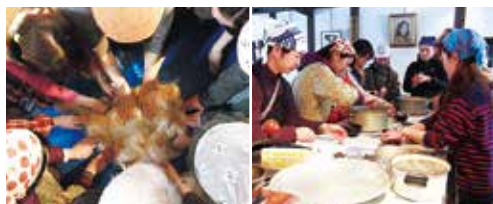
みんなで味噌作り(昨年のプログラムより)