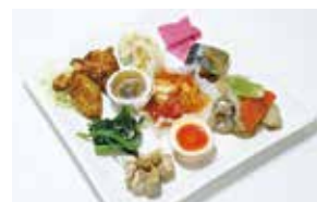
おいしいものをチョッとずつのランチ ※写真はイメージです