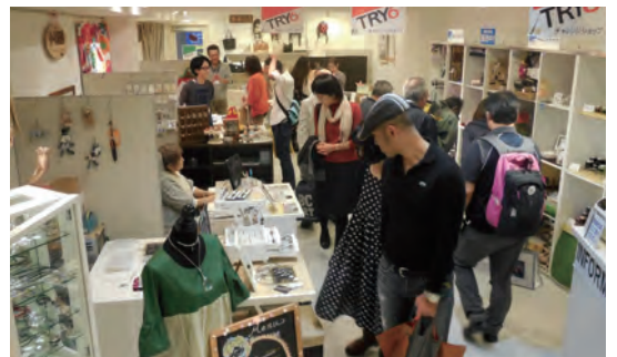
出店中の館内の様子