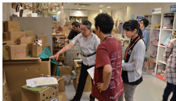
勉強会・ディスプレイ講習の様子