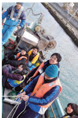
桂島での漁業体験