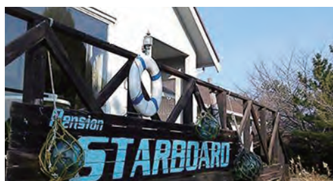
宿泊先:ペンションスターボード(1室 2名〜4名利用可能)