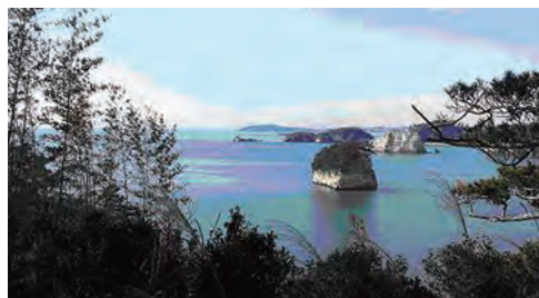
寒風沢島日和山から

■注意事項 ※風、波等海上の天候等の理由により行程が変更となる場合がございます。 ※画像はイメージです。