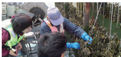
桂島での漁業体験