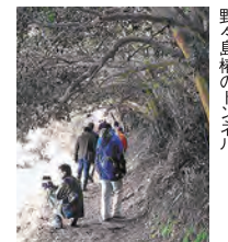
野々島権のトンネル