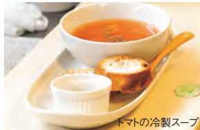
トマトの冷製スープ

今回は主菜、サラダと続き第3弾チャレンジカフェはスープ。暑い夏にぴったりな冷製スープを題材にして原価計算を学びました。今回は2種類のスープで味の違い、原価の違いを比較しながら、適正な売価について皆さんと考えました。「かぼちゃの冷製スープ」と「トマトの冷製スープ」をそれぞれ手作りと市販品で用意、どれがどれなのか明かさずに、参加者全員で食べ比べをしました。手間のかかった手作りの物、原価率の高いものに人気が集まるのでは? という予想を裏切り、味や価格に関する参加者の意見はバラバラ…。お金をかければ評判が良いわけではない、また万人に支持される100%の味というものはないのだと、再認識をする結果となりました。