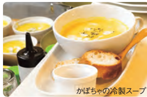
かぼちゃの冷製スープ