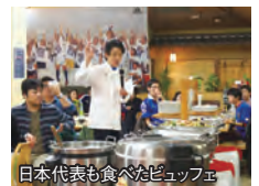
日本代表も食べたビュッフェ

8:00仙台駅→貸切バス(東北道)→11:30レストラン「アルパインローズ」西シェフのお話、ビュッフェランチ→14:00広野町内農家 見学→貸切バス(東北道)→19:15仙台駅