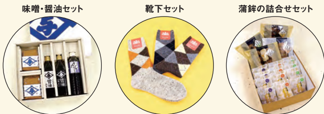
※写真は景品のイメージです。

投票特典:特別賞 ご投票者から抽選でお菓子の詰合せや蒲鉾詰合せ・塩竈地酒セットなど、参加各店の自慢の景品を 40名様 へ進呈!