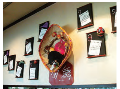
※写真は前回のディスプレイの様子です。