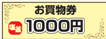
※お買物券はイメージです。

投票特典:商人賞 あきんど ご投票者から抽選で参加各店で使用できるお買物券1,000円分を 100名様 へ進呈!