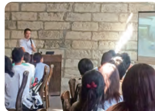
一関「世嬢の一酒造」

会議で東北を訪れた方、東北にお住まいの方、そしてそれぞれの地域で復興に向けて活動されている方、どなたでもお申込みいただけます。旅を通して交流を深め、これからの防災と地域について考えるまたとない機会です。詳しい内容は、たびむすびのWEBサイトで。