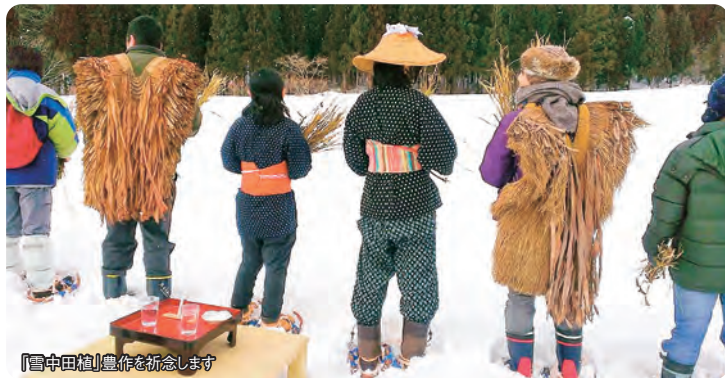
『雪中田植』豊作を祈念します

旧暦1月15日は「女の年取り」とも言われる小正月。鳴子温泉鬼首地区では、地域に伝わる小正月の風習を残そうと、小正月体験イベントを毎年開催しています。かんじきをはいて雪の中を歩き、その年の豊作を願う雪中田植など、小正月行事の体験を通して鬼首地区を知り、地域の皆さんと交流を深めます。帰りたいふるさとがきっとひとつ増える、そんなツアーです。