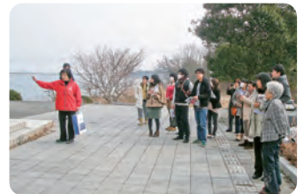
南三陸町語り部による学びのプログラム