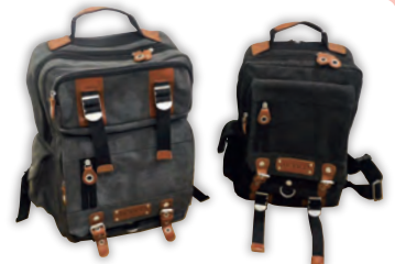
①リュックサック ②メガボディバッグ

洗い加工の施された丈夫な帆布生地と、本革のコントラストが絶妙な『DEVICE Access』シリーズ!普段使いはもちろん、ビジネス用としても是非どうぞ!