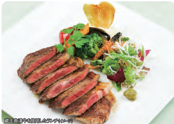
蔵王爽清牛を使用したランチ(イメージ)