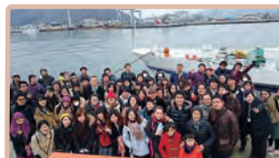
今回は70名で「行ってきました」!