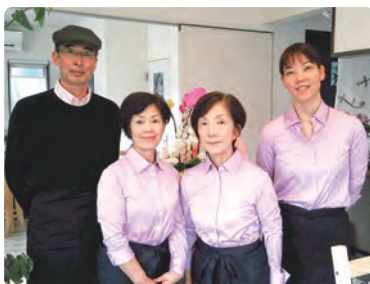
カフェ・モリナールのスタッフの皆さん