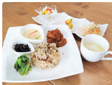
寝かせ玄米のランチセット