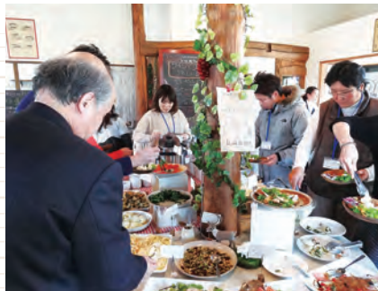
ルロアヴァンのビュッフェ