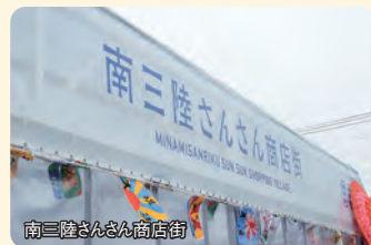
南三陸さんさん商店街