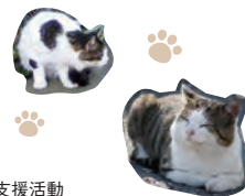
<企画>JC-21教育センター 地域における草の根支援活動