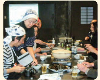
齊吉商店・ばっばの台所