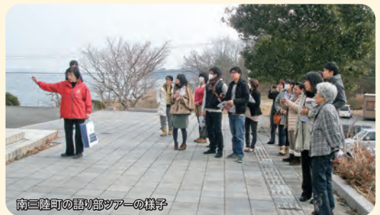
南三陸町の語り部ツアーの様子

大震災という危機的な状況のなか、いかにして動き出したか。当時の状況を知る地域のリーダーから講話をいただき、産業復興に必要な視点を学びます。