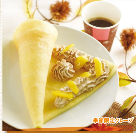
季節限定クレープ カフェタイムクレープ