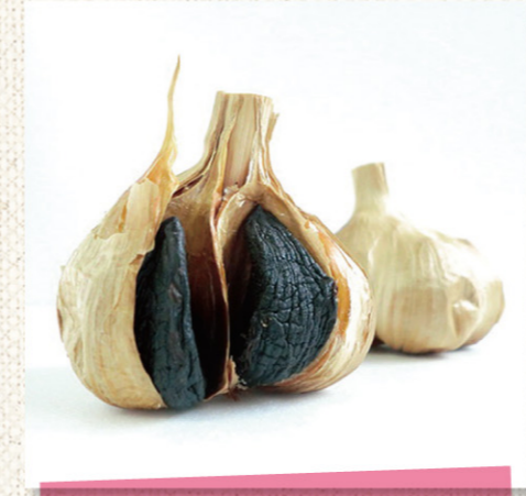
わくわくニンニク

店主の ひとこと 素材には主にアクリルビーズを使用。店主が一つ一つ丁寧に作ったビーズ雑貨を手頃な価格で楽しむことができます。