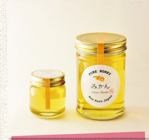
Bee Port Japan (ビーポートジャパン)

店主の ひとこと ニンニク特有の辛みはほとんどなく、甘くてフルーティーな味が特徴の黒ニンニク。1日1片を目安にお召し上がりください。