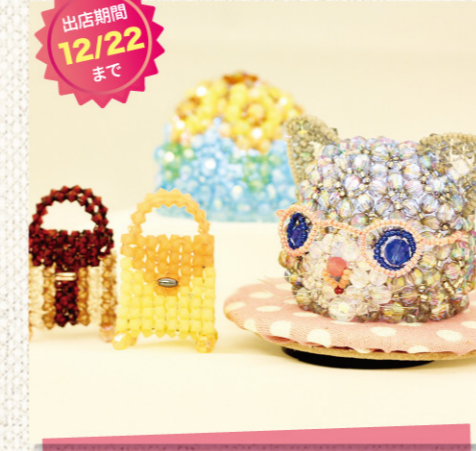
出店期間 12/22 まで Beads-be (ビーズビー)

店主の ひとこと ハーブや精油で生活にちょっとした特別感を…。初心者にも使いやすい、好きな香りを加えて楽しめるコスメもご用意しています。