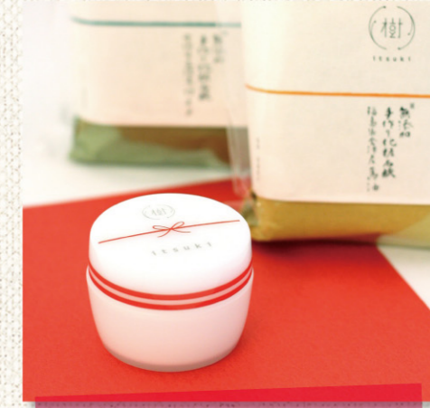
地球の恵 (ちきゅうのめぐみ)

店主の ひとこと 寒い時期、温かい紅茶やショウガ湯のアクセントにぴったりのはちみつ。プレゼント用のギフトBOXもご用意しております。