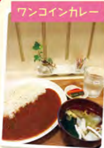
ワンコインカレー

また、年明け1月2日、3日の2日間は、トマトカレーとコンソメスープのセットを何とワンコインの初売り価格(500円)で提供します。さらに、「蔵王咲き茶」(裏面の読者プレゼント欄に掲載)などが当たる「正月くじ」付き。残念ながら、外れてしまった方にも参加賞として、昼・夜どちらでも使える「みやカフェサービス券」をプレゼントします。