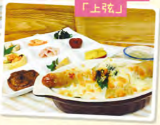
みやプレート「上弦」