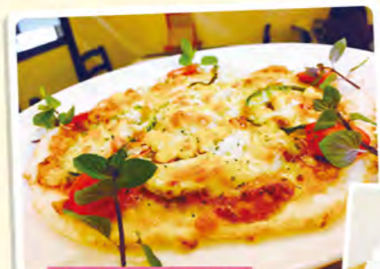
みやカフェオリジナル 特製ライスピザ