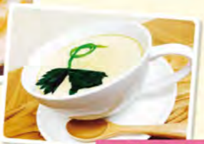
竹鶏たまごの茶碗蒸し