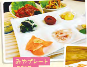
みやプレート「新月」