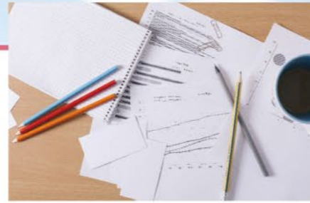
画像はイメージです