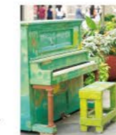
画像はイメージです