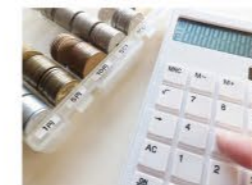
画像はイメージです

「領収書を取っておけば、とりあえず大丈夫かな?」「もうすぐ初めての決算だけど、どうしよう…」ビジネスを始めたばかりで経理で困っている方へ、収入・支出の管理や、経費の仕分け方、必要な書類の作り方などを2回の講座でわかりやすくお伝えします。