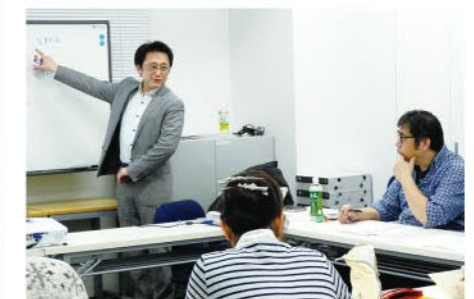
過去のセミナーの様子