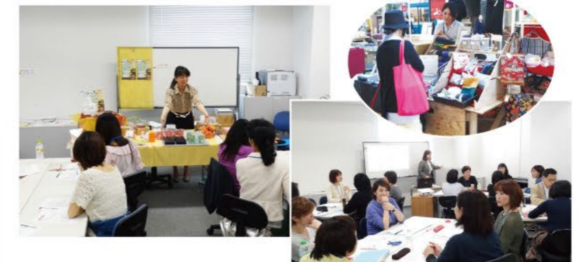
画像は全てイメージです

当講座を受講した方は、 仙台市中心部でのマルシェに無料で出店できます (ただし、当日の売上手数料はご負担いただきます)