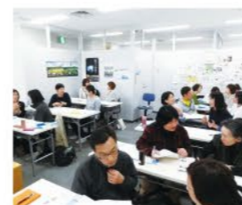
過去のセミナーの様子