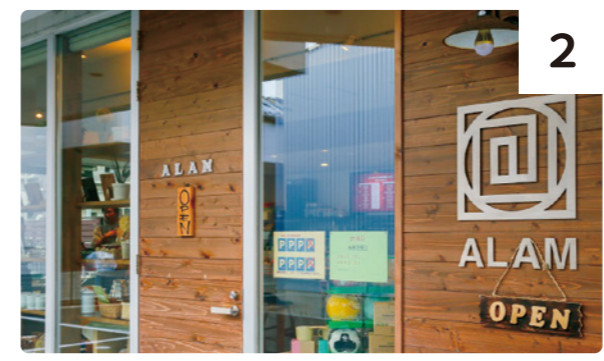
＜アライのステキを教えたい！＞

仙台をふらっとまち歩き 仙台ふららん http://www.sendai-furaran.com/ ※画像はイメージです ※集合場所と解散場所が異なる場合があります。 ご注意ください。