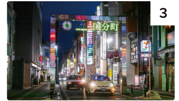
＜行きたかった、あのお店。＞

集合場所：JR仙山線・北仙台駅前 集合 定員：35名 催行決定済 申込締切：3/8(水) ※なお、当日は14:46に黙禱を行います。