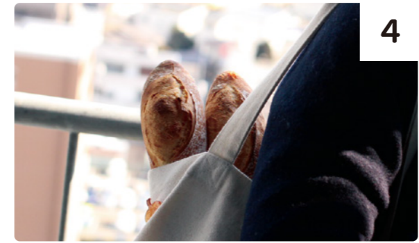
＜買い過ぎ注意。リュックを用意。＞

集合場所：地下鉄東西線「荒井」駅 改札前 集合 定員：10名(最少催行人数5名) 申込締切：3/9(木)