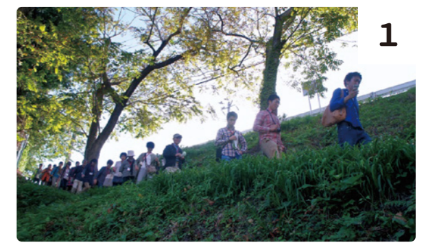
＜のぼりくだりのスリパチが＞

集合場所：JR仙台駅2階中央改札口ステンドグラス前集合 定員：10名(最少催行人数5名) 申込締切：4/20(木)