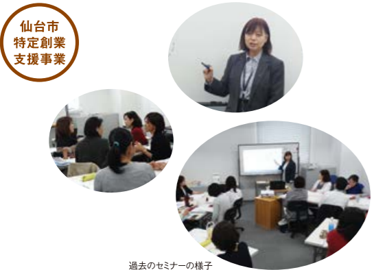
過去のセミナーの様子