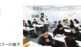
過去のセミナーの様子

「いつか何かを始めたい」「自分の得意なお金に換えてみたい」「子育てがひと段落したら始めたい」「副業ってなに？」好きなこと・やりたいことを仕事にするとどんなことか、自分の考えをまとめたり、同じクラスの受講生と意見交換したり、一歩ずつ自分のプランをまとめて事業計画書を作成していくコースです。企画、思案中、始めたばかり、始めたけれど再考中、という方に向いています。