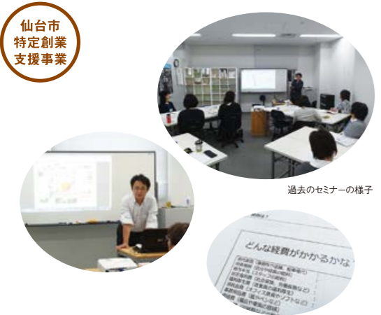
過去のセミナーの様子

本講座は仙台市の特定創業支援事業です。所定の要件を満たして終了した方は、会社設立時に様々な支援を受けられます。詳しくは、仙台市ホームページにてご確認ください。 http://www.city.sendai.jp/business/d/1217366_1434.html