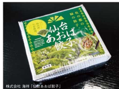
株式会社 海祥「仙台あおば餃子」

実は、過去に1回、仙台で餃子イベントが開催されたことがあり、それぞれ8万人、6万人という入場者でした。「すごいですね」と言っていると「まだまだです」とお二人。「あおば餃子」と「餃子まつり」とたくさんの方に知っていただくために、がんばりますとのこと。皆さんも、ぜひ6月9日と10日は、餃子まつりの会場「青葉山交流広場(地下鉄東西線国際センター駅北側)に足を運んでみてください。