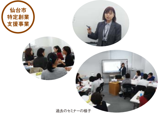
過去のセミナーの様子