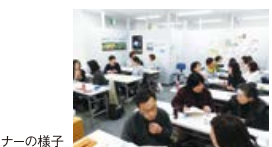
過去のセミナーの様子