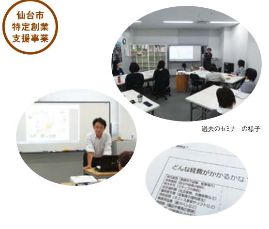
過去のセミナーの様子

本講座は仙台市の特定創業支援事業です。所定の要件を満たして終了した方は、会社設立時に様々な支援を受けられます。詳しくは、仙台市ホームページにてご確認ください。 http://www.city.sendai.jp/business/d/1217366_1434.html