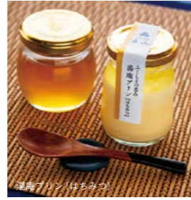
湯庵プリン(はちみつ)