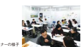
過去のセミナーの様子