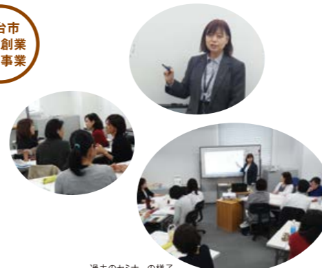
過去のセミナーの様子

「いつか何かを始めたい」「自分の得意なお金を換えてみたい」「子育てがひと段落したら始めたい」「副業ってなに?」好きなこと・やりたいことを仕事にするとはどんなことか、自分の考えをまとめたり、同じクラスの受講生と意見交換したり、一歩ずつ自分のプランをまとめて事業計画書を作成していくコースです。企画中、思案中、始めたばかり、始めたけれど再考中、という方に向いています。