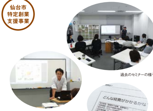
過去のセミナーの様子

「なんとなくやりたいことがまとまってきたので、じっくり計画書を作成したい」「本業を続けながら、新しいことにチャレンジしたい」「すぐには大きな売上金額にはならないかもしれないけれど取り組んでみたいことがある」先生や受講生とのディスカッションやワークシートの作成を通して、自分の考えを固めていきます。すでにプランがある、そろそろ本腰を入れて取り組みたい、すでに始めているが見直したいという方に向いています。過去に基本講座を受講した方で、さらに詳しく考えたいという方もご参加ください。